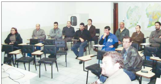
Representantes das quatro empresas discutiram indicadores de desempenho