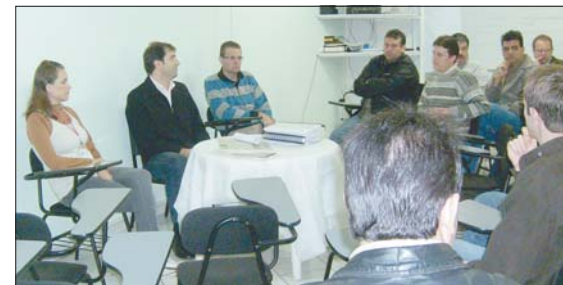
Reunião detalhou trâmites da licitação